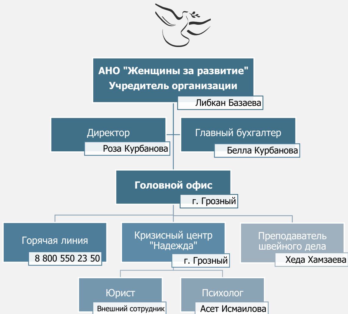
Рис. 1. Структура АНО «Женщины за развитие»