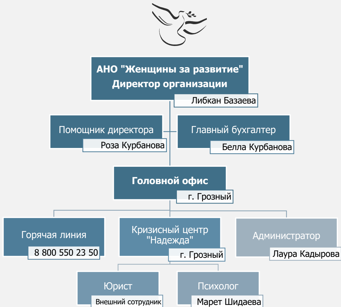
Рис. 1. Структура АНО «Женщины за развитие»