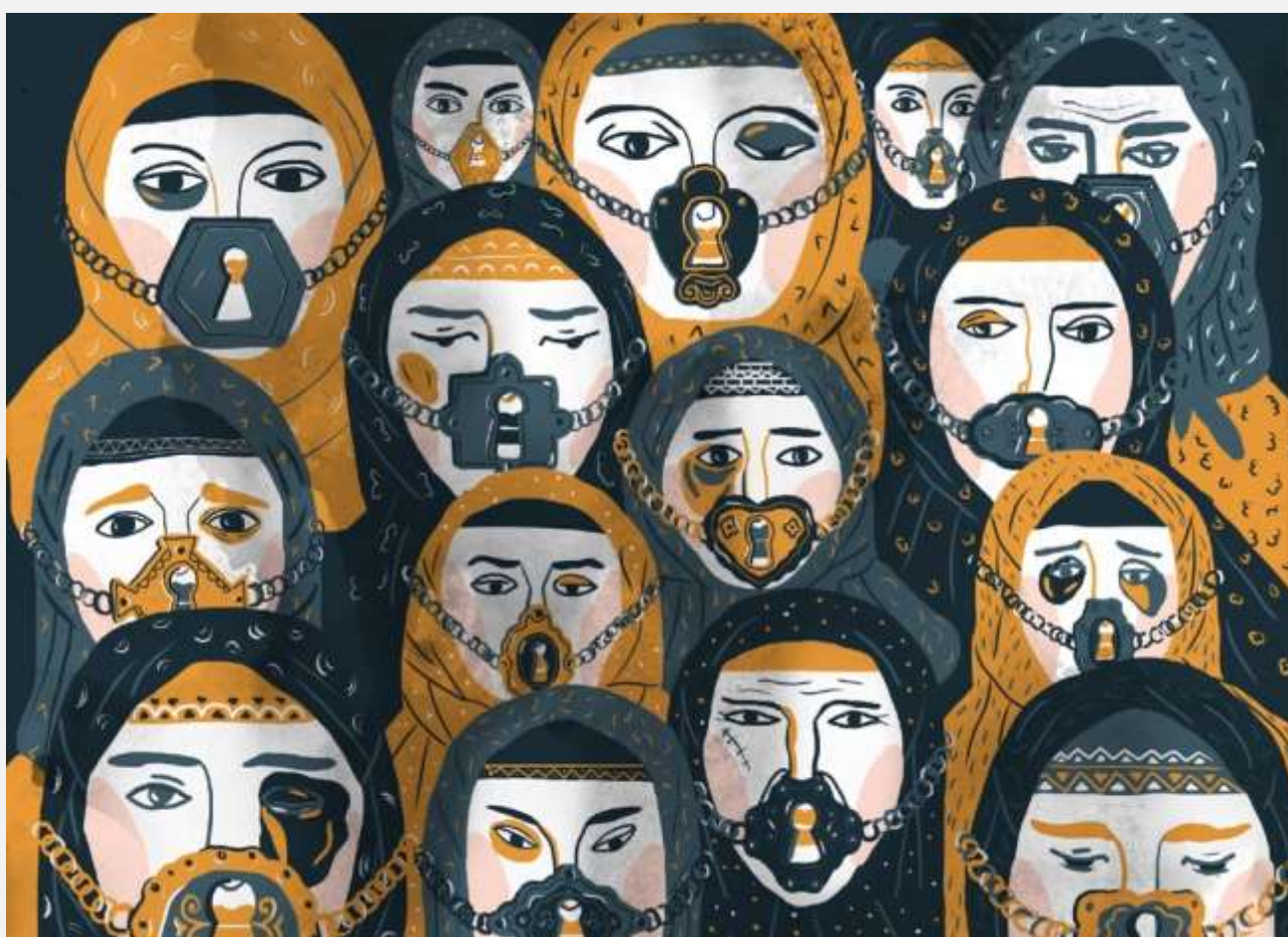
Иллюстрация – Полина Плавинская

Горячая линия оказания психологической помощи жертвам домашнего насилия на Северном Кавказе