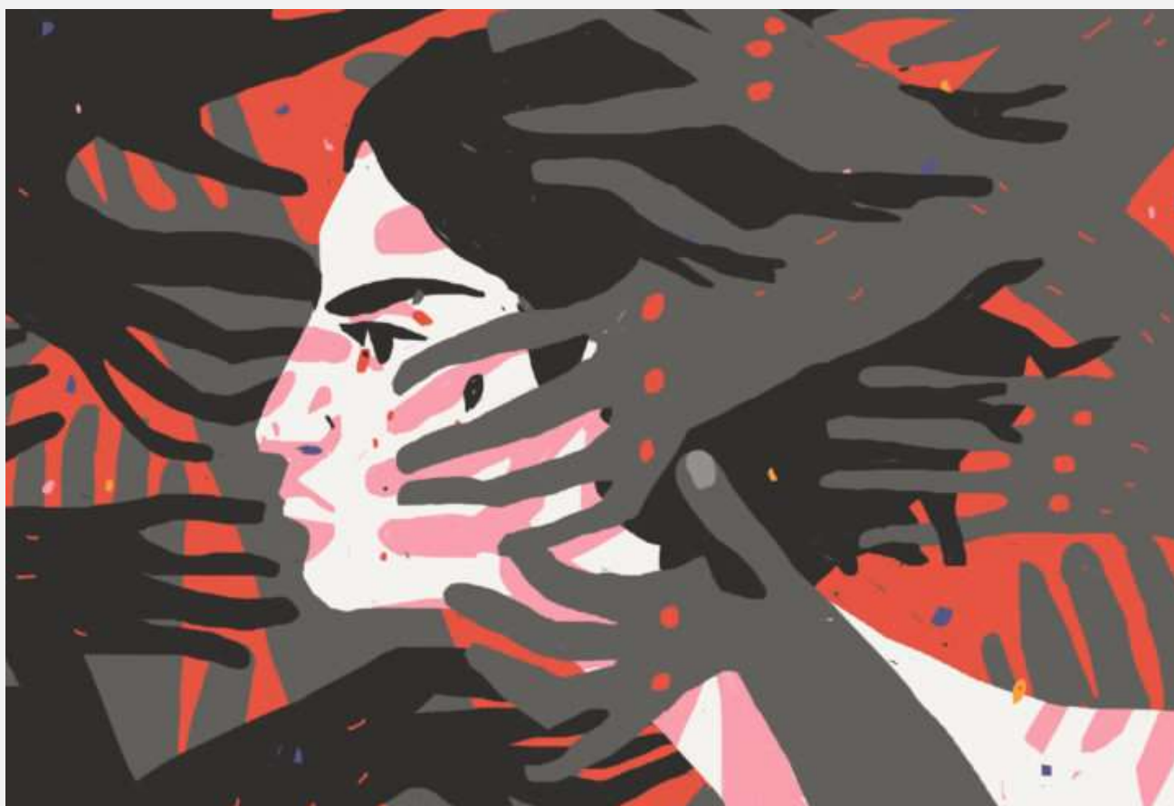
Иллюстрация – Мария Бойнова

Проект помогает одинокой матери в декрете с двумя детьми, оказавшейся без жилья и средств к существованию