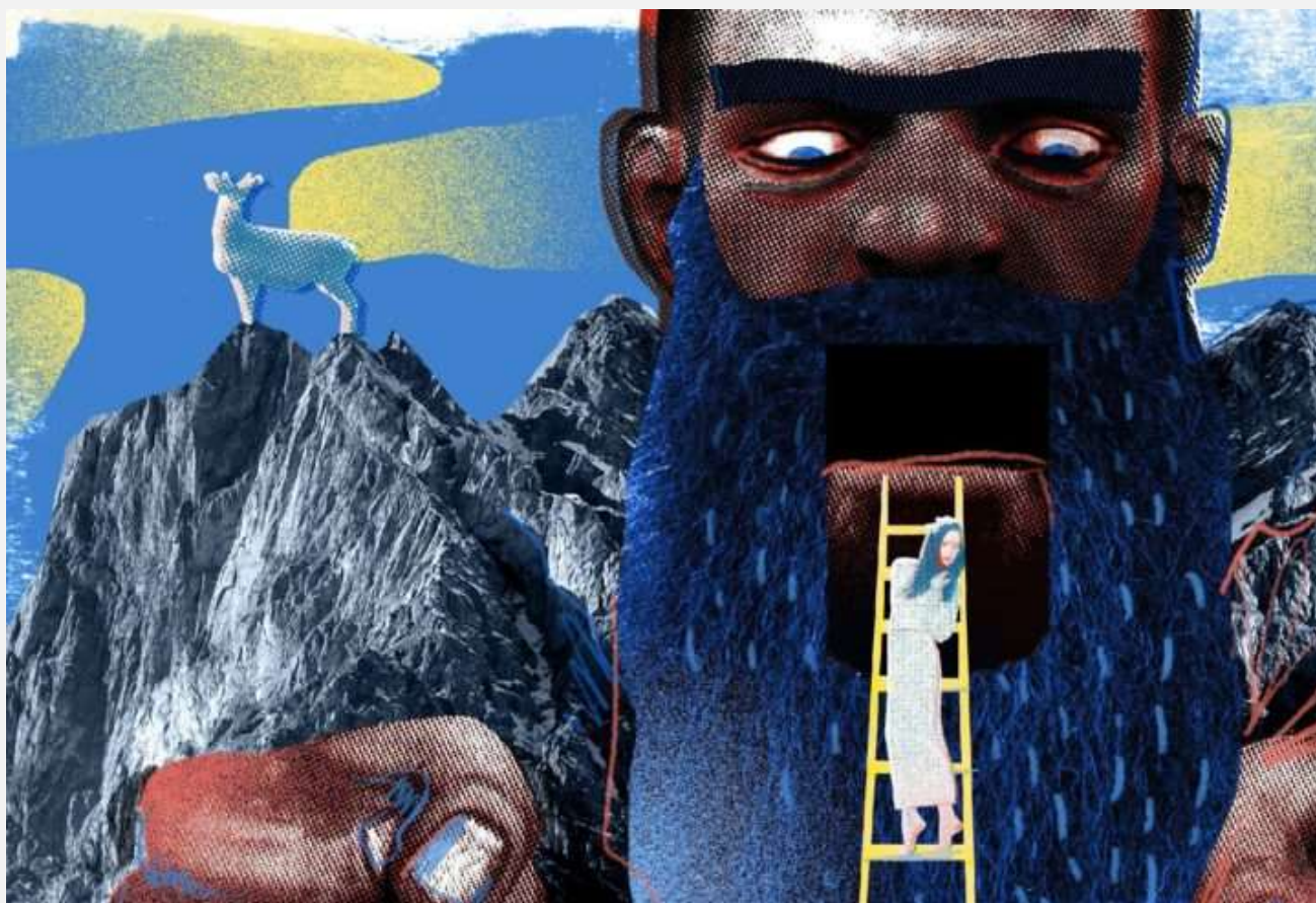
Иллюстрация - Ольга Прохорова

Открытие первого центра оказания срочной помощи в кризисной ситуации женщинам, детям и семьям в трудной жизненной ситуации на территории Северного Кавказа